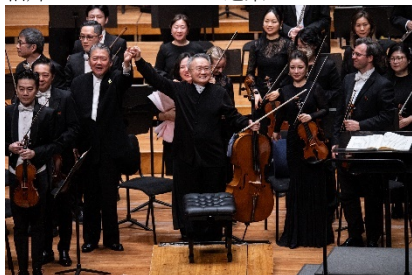
4. 武漢琴台音樂廳