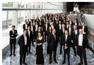
12. 北京國家大劇院