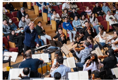
9. 港樂與哈爾濱交響樂團進行公開聯合排練