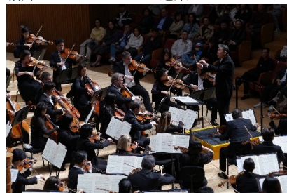
6. 哈爾濱音樂廳