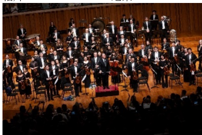
14. 北京國家大劇院