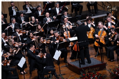
5. 長沙音樂廳