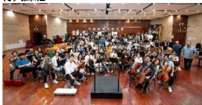
13. 余隆及港樂各聲部首席到訪中央音樂學院舉行大師班